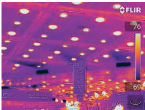
MSX* permette di vedere molti più dettagli sull'immagine termica.